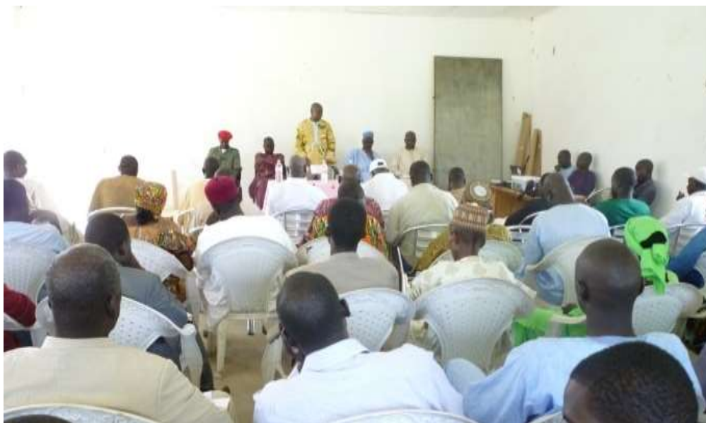
Figure 1 : Séance de validation des cadres logiques par les Sectoriels

Le CDMT s'est élaboré sur les 7 secteurs sociaux en tenant des caractères participatifs. Le PIA s'est battu sur les projets urgents et communautaires.