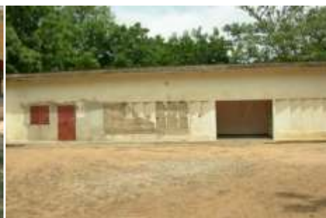
Bâtiment de la commune